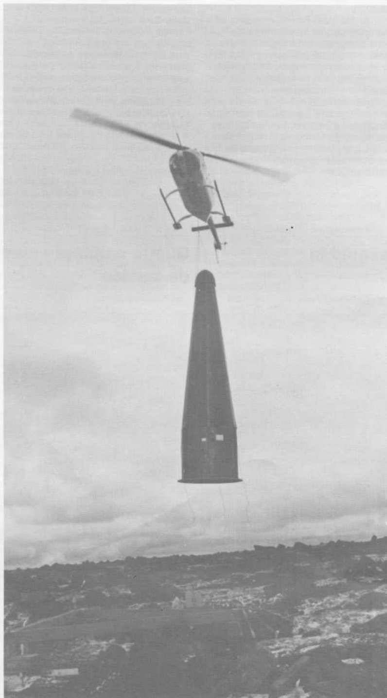
Helicopter carrying Comshell to Flat Mountain, Yukon, 2000 meters above sea level.